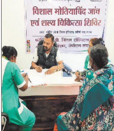
शिविर में जांच कराते मरीज और उपस्थित ग्रामीण।

प्रायः देखा गया है कि नेत्रहीनता का प्रमुख कारण मोतियाबिंद है। प्रतिवर्ष मोतियाबिंद के लाखों नए मामले सामने आते हैं। लेकिन