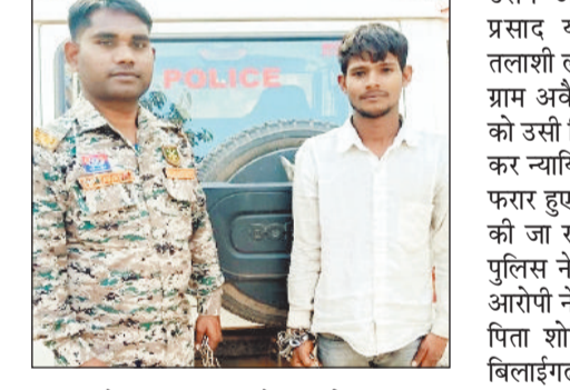
पुलिस ने तत्परता दिखाते हुए मोटरसाइकिल चालक को घेराबंदी कर पकड़ा। पूछताछ में