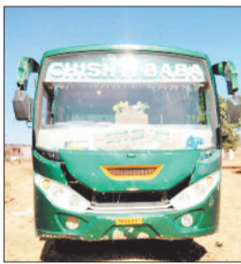
एक सप्ताह के अन्दर बकाया कर जमा नहीं करने पर प्रवधानों के तहत वाहनों की जाएगी नीलामी

परिवहन विभाग से प्राप्त जानकारी अनुसार जप्त किए गए वाहनों में भगत बस सीजी 14 जी 0338, सीजी 14 एमएल 0238, चिस्ती बस सीजी 14 जी 0197, होहारही बस सीजी 14 एमजी 9461 एवं बस सीजी 14 एमएफ 6739 शामिल हैं। विभाग द्वारा जानकारी दी गई है कि अधिनियम की धारा के अधीन कोई कर, शांति या ब्याज उसी रीति में वसूल किया जा सकेगा जिस रीति में भू-राजस्व की बकाया वसूल की जाती है। अधिनियम की धारा के अनुसार बकाया कर संबंधित वाहनों के कर, शांति एवं ब्याज की वसूली हेतु वाहन एवं उसके उपसाधनों को भू-राजस्व